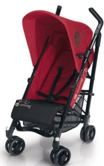
// DESIGN PEPPER