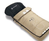
// DESIGN DUMBO