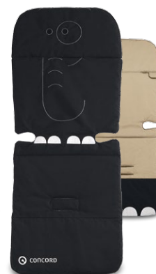
// DESIGN DUMBO