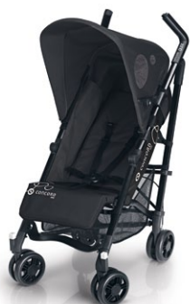
// DESIGN DARK NIGHT