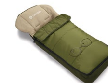
// DESIGN BIRDIE