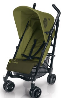
// DESIGN LIME