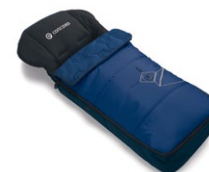
// DESIGN ROBOT

El saco de dormir COCOON mantiene al niño caliente incluso en los días fríos de invierno. Disponible en cuatro diseños diferentes.