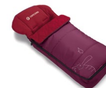
// DESIGN DRAGON