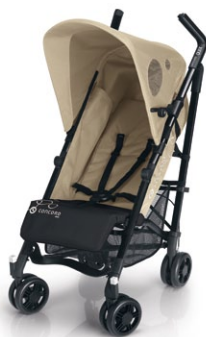
// DESIGN SAHARA