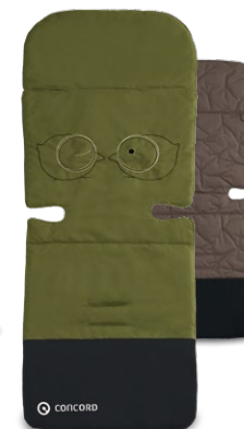
// DESIGN BIRDIE