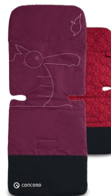
// DESIGN DRAGON