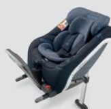
Deep Water Blue